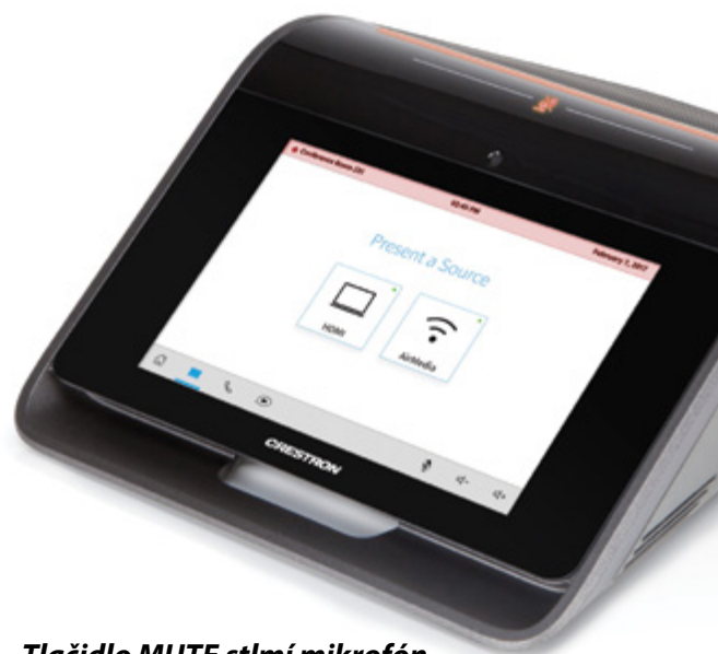
Tlačidlo MUTE stlmí mikrofón a rozsvieti červenú signalizáciu

Vďaka zabudovanej technológii Crestron AirMedia už si nemusíte pri prezentáciách podávať HDMI kábel okolo stola. Každý účastník konferencie dokáže prezentovať to čo má na obrazovke svojho PC jedným kliknutím myši. Crestron AirMedia podporuje operačné systémy Windows, iOS aj Android , takže sa rýchlo a jednoducho pripojíte z akéhokoľvek zariadenia, ktoré máte momentálne poruke.